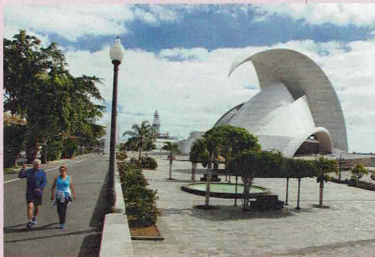
Auditorio de Tenerife Adán Martín, het operagebouw.