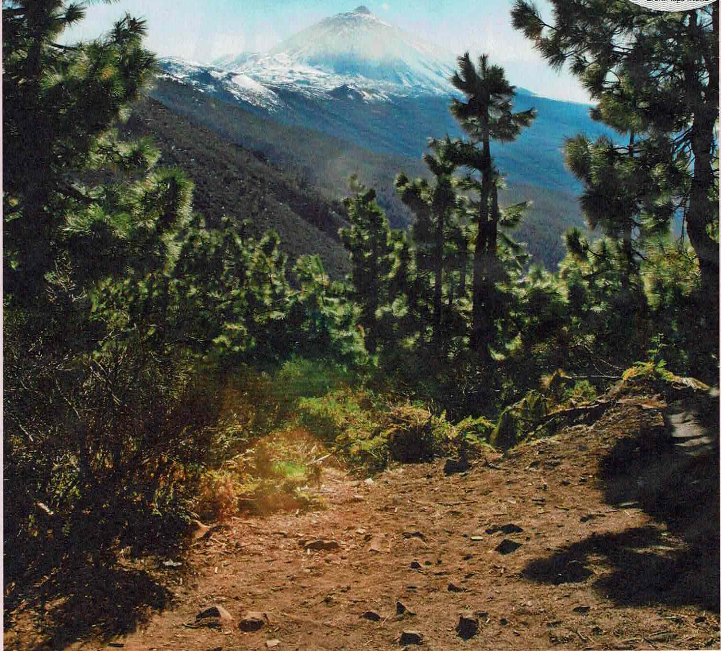
Naaldbos aan de voet van El Teide, de grootste vulkaan op Tenerife.