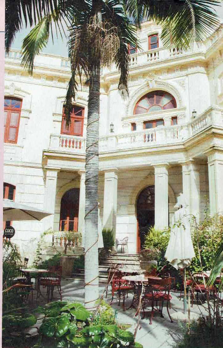
Een terras in de stad San Cristóbal de La Laguna.

OP DE BINNENPLAATS van een oude bananenplantage begint het te dagen: Tenerife is helemaal geen goedkope bestemming voor winterzón. Althans, dat hoeft het Spaanse eiland niet te zijn. De eerbiedwaardige Balthasar Ponte wijst op een beeld van zijn voorvader die het witgekalkte landhuis in 1565 liet bouwen. 'Zeventien generaties terug alweer', zegt de 75-jarige edelman in de schaduw van een grote drakenbloedboom. 'Die staat hier ook al zeshonderd jaar.' Om het onderhoud van het landgoed te kunnen betalen, verbouwde de familie de stallen en personeelsvertrekken tot twintig rustieke hotelkamers. Vanaf het bordes is de Atlantische Oceaan te zien. Zoals bijna overal op Tenerife. Het donkerblauwe water deint traag en horizonvullend op en neer. De golven spatten witschuimend tegen hoge kliffen kapot. Alleen in het droge zuiden zijn er witte stranden omzoomd door lichtblauw water, en