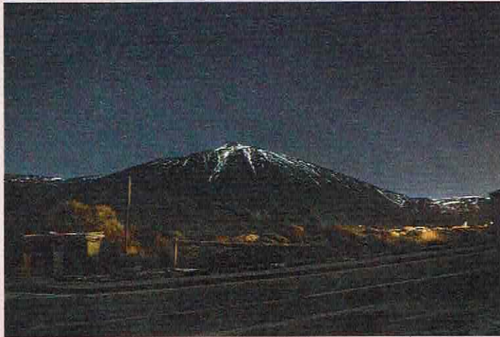
De avondlucht bij de sterrenwacht.