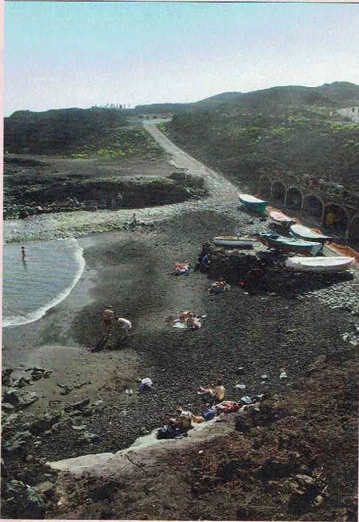
Een strand met zwart vulkanisch zand.