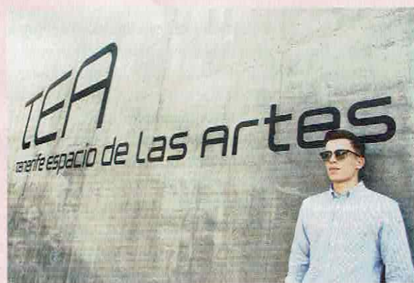
Een bezoeker van het TEA, Tenerife Espacio de las Artes.

geeft. Of zoals de eilanders zeggen: 'de bomen melken de wolken'. Wie omhoog fietst door het koele naaldwoud, fietst dus een stuk door de donutvormige wolkenzee. Daarboven groeien planten zoals de drakenbloedboom die een rood sap afscheidt als je 'm inkerft. Er staan zuilen met rode bloemen op de zwarte lavavelden en tere roze klokjes in het donkere laurierwoud van het noorden.