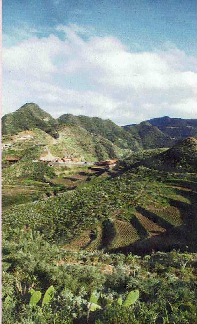
Het berglandschap rond de vulkaan.