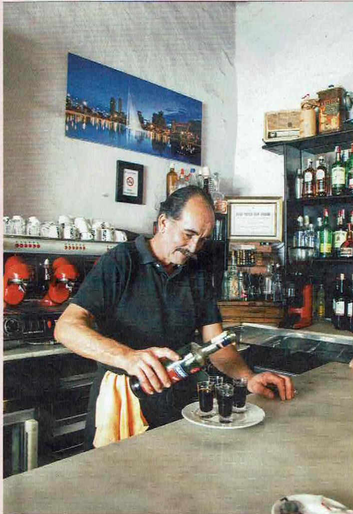
De barman van La Hierbita.

cola en cayennepeper, en tot slot een witte suikerspin die zweeft als de wolkenzee rond de vulkaan. 'Mijn uitdaging is ook toeristen binnen te krijgen,' zegt de jonge chef op gympen en met baardje. 'Sinds ik die ster heb, weten ze me wel makkelijker te vinden.'